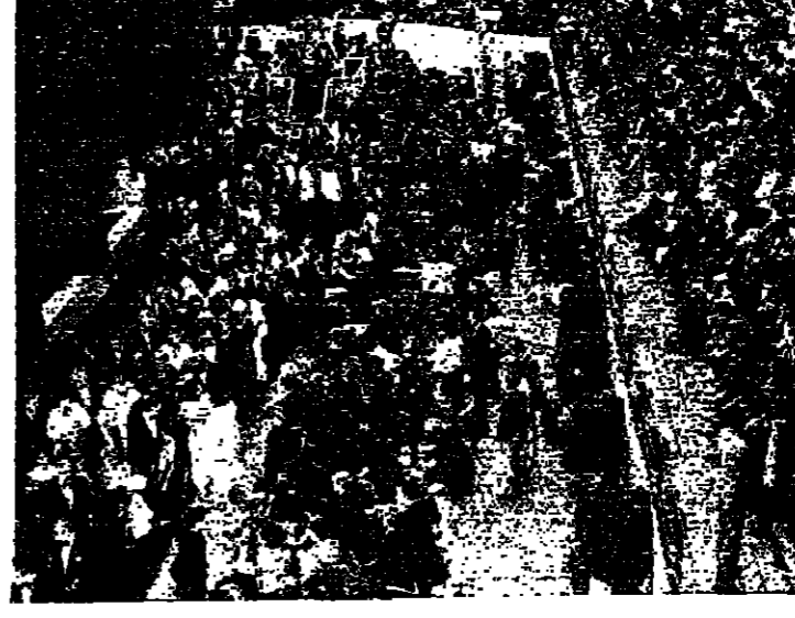
الجماعي امام قاعة العرض